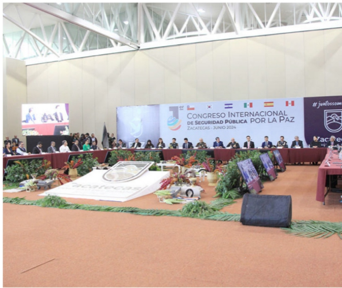
El Palacio de Convenciones se convirtió en el Salón de la Farsa

El narco recibió el bodrio ese llamado “Primer Congreso Internacional de Seguridad Pública por la Paz”, con dos asesinatos, como lo revela el informe diario de homicidios dolosos del Gobierno de México