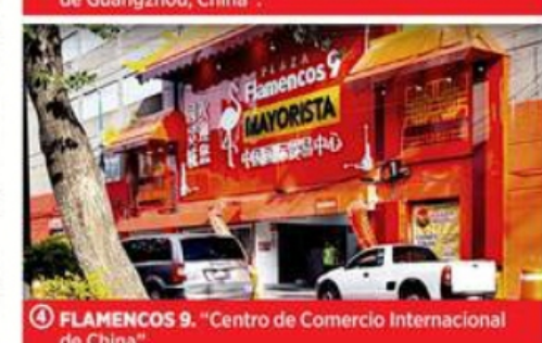
4 FLAMENCOS 9. "Centro de Comercio Internacional de China".

plenas condiciones de seguridad. Antes albergaba oficinas de la Tesorería de la Ciudad de México y de SACMEX.