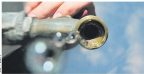
OTRO POZO o sistema es necesario: funcionario.