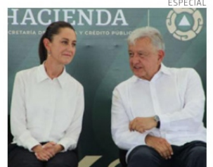
Sheinbaum y AMLO, de gira.

Fluidez. Este sábado la presidenta electa, Claudia Sheinbaum, acompañó al mandatario Andrés Manuel López Obrador a Tamaulipas, donde supervisaron la nueva sede de la Agencia Nacional de Aduanas en Nuevo Laredo. Sheinbaum dijo que confía en que esta nueva sede ayudará a mejorar el comercio y acabará con la corrupción. PAG 5