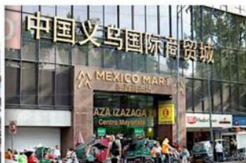
2 IZAZAGA 89. México Mart. "Ciudad de Comercio Internacional de Yiwu, China".