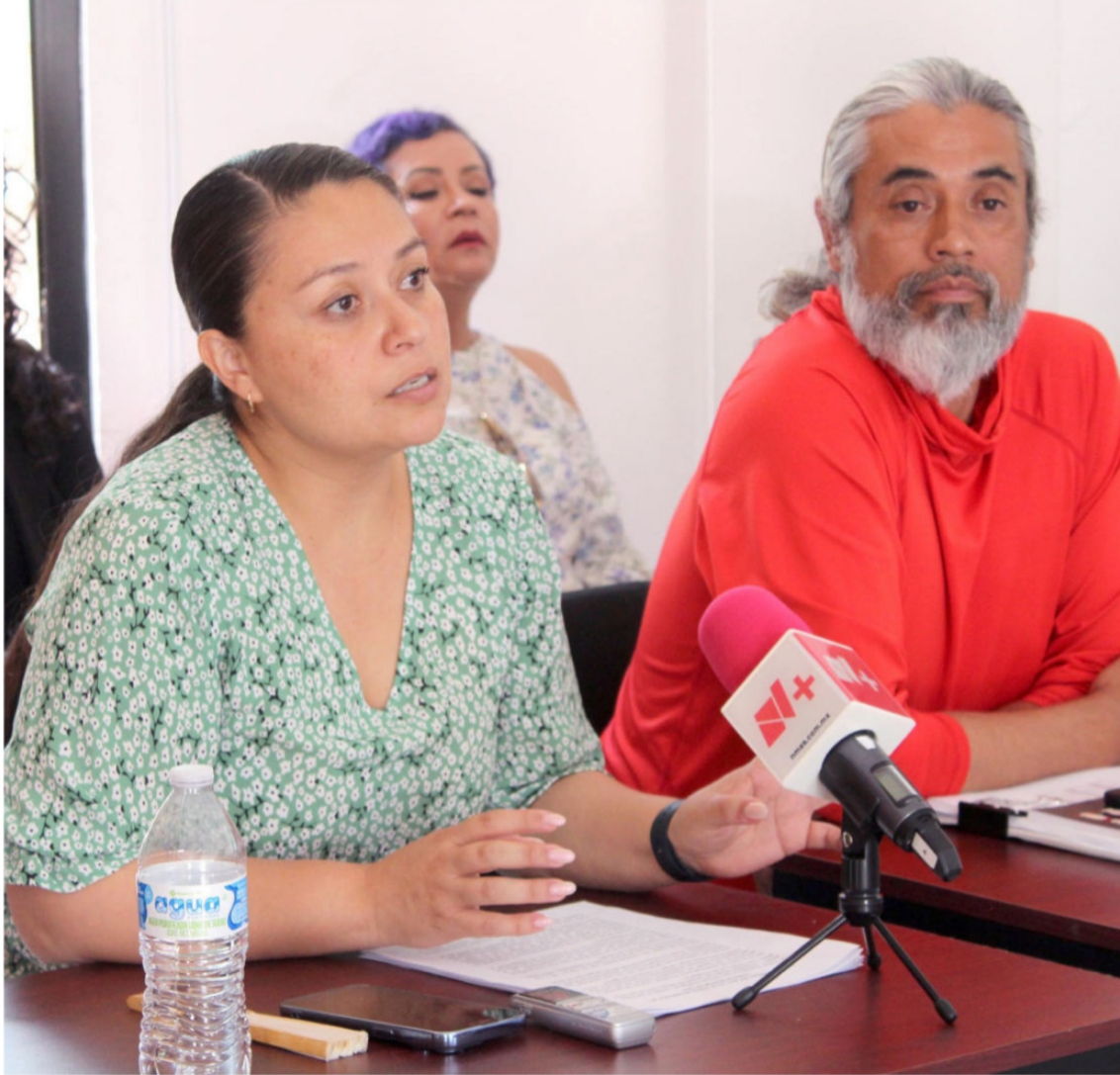
Docentes de la Unidad Académica de Biología de la Universidad Autónoma de Zacatecas, en rueda de prensa