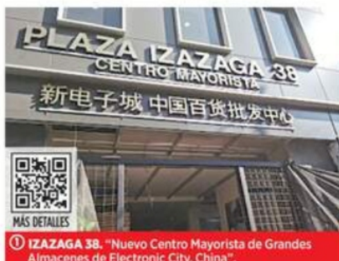
1 IZAZAGA 38. "Nuevo Centro Mayorista de Grandes Almacenes de Electronic City, China".