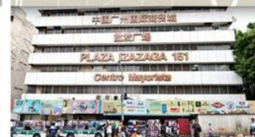
3 IZAZAGA 151. "Ciudad de Comercio Internacional de Guangzhou, China".