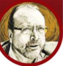
Ilustración: Jesús Sánchez

La nueva novela de William Ospina es sobre un personaje clave de la Segunda Guerra Mundial. / 18