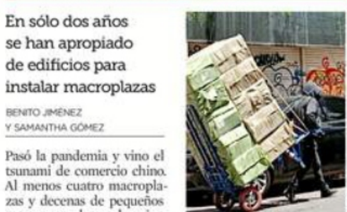
Decenas de cargadores llevan mercancía a las plazas.