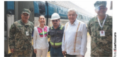
LA VIRTUAL Presidenta electa y el Presidente Andrés Manuel López Obrador, ayer, en Oaxaca.

MUESTRAN efectos las medidas para restringir el tránsito hacia el norte; en mayo, 170 mil detenciones; activistas ven como consecuencia un varamiento de indocumentados en México. pág. 10