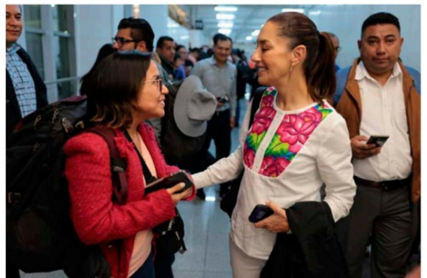
La segunda gira de fin de semana de la presidenta electa será en Oaxaca, lo que dio oportunidad a que Sheinbaum conviviera en el aeropuerto con los pasajeros con los que compartiría vuelo