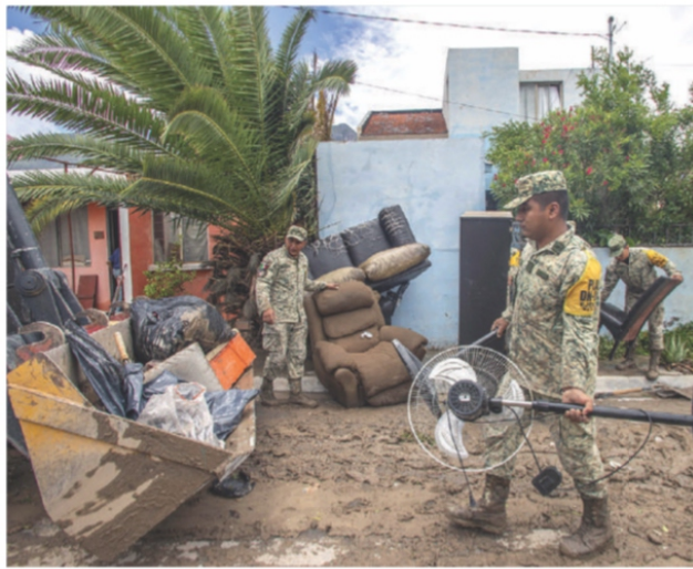
ELEMENTOS de la Sedena activaron el Plan DN-III-E en Nuevo León, ayer.

EN NUEVO LEÓN , desgajamientos y la presa La Boca al 105% de llenado; en el sistema Cutzamala, lo opuesto: optan por bajar caudal. págs. 4 y 5