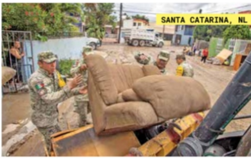
SANTA CATARINA, NL

Mientras los estragos que dejó Alberto aún no se mitigan (der.), un nuevo sistema con potencial desarrollo ciclónico en el Golfo de México podría impactar el domingo en los límites entre Veracruz y Tamaulipas, alertó el Meteorológico. / 16