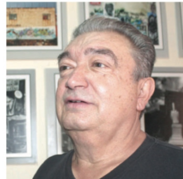
“Ya la Gente Tiene Miedo Salir”