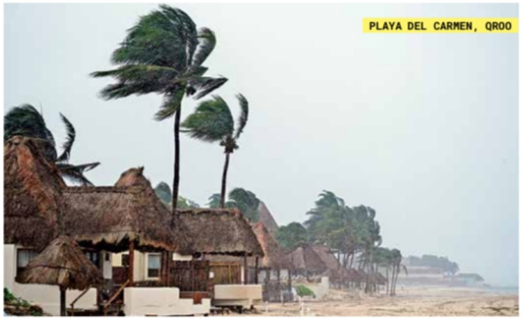
PLAYA DEL CARMEN, QROO

Alberto llenó la presa La Boca, que abastece a la zona metropolitana de Monterrey.