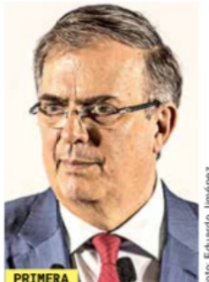
PRIMERA Tecnología, vía de oportunidad: Ebrard

Juan Ramón de la Fuente, próximo canciller, habló ayer con Antony Blinken, secretario de Estado de Estados Unidos