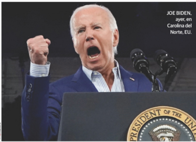
JOE BIDEN, ayer, en Carolina del Norte, EU.

PRESIDENTE reconoce que no camina o habla con la facilidad de antes, pero "sé cómo hacer este trabajo". pág. 16