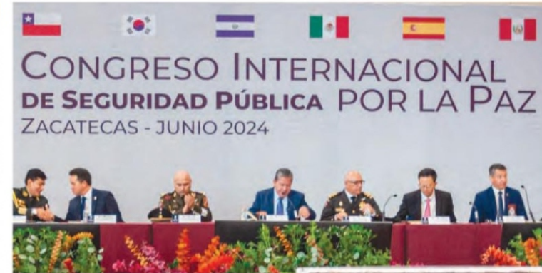
IMPARTIERON varias conferencias.

Durante la inauguración, expuso que este evento es muestra de la cooperación