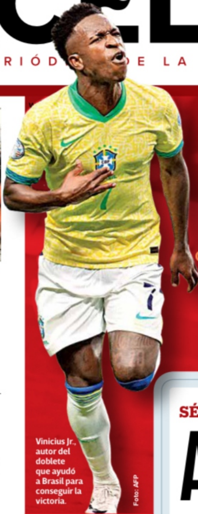
Vinicius Jr., autor del doblete que ayudó a Brasil para conseguir la victoria.

El fraccionamiento Rancho San Blas, en Cuautitlán, quedó bajo el agua debido a las precipitaciones registradas la noche del jueves y madrugada del viernes. El Meteorológico alertó de un potencial ciclón que provocará más lluvias en el país. / 13