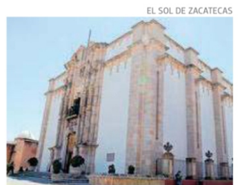
EL SOL DE ZACATECAS

El INEGI informó que Zacatecas logró un aumento anual en sus exportaciones luego de que en 2023 sufrió una caída del 23%. Durante el 2024, las exportaciones llegan a 850.8 mdd. Pág. 3