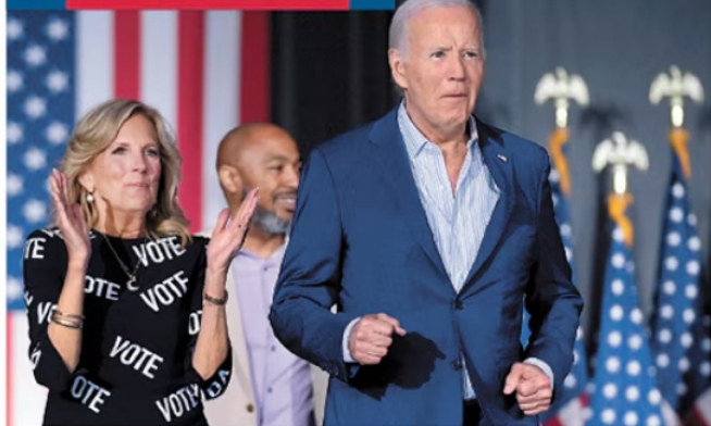
El presidente estadounidense Joe Biden, con su esposa Jill, en un mitin en Raleigh, Carolina del Norte, un día después del debate contra el exmandatario Donald Trump.