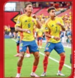
La selección de Colombia suma 25 juegos sin derrota.