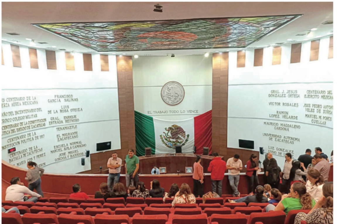
Trabajadores del Congreso del Estado impiden que se lleve a cabo la sesión, exigen un bono trianual de 20 mil pesos