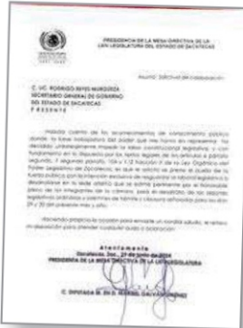
Solicitaron el apoyo.

tomó el edificio legislativo el pasado viernes, este sábado los diputados intentaron sesionar en una sede alterna -el auditorio del Consejo Zacatecano de Ciencia, Tecnología e Innovación- pero los trabajos fueron interrumpidos por los inconformes. Pág. 5