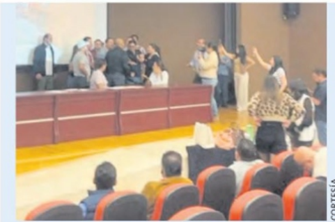
IRRUMPIERON los trabajadores en la sesión del Cozcyt.