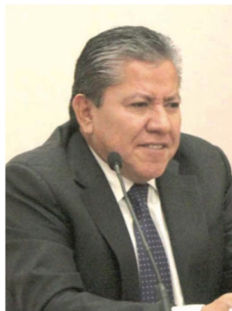
David Monreal Avila