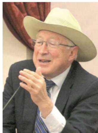
Kenneth Lee (Ken) Salazar

mintió no solamente diciendo que nos regresaría la paz y la tranquilidad, sino el progreso, promesas que a su casi tres años de desgobierno, está muy lejos de cumplir: las estadísticas no mienten, en casi todo Zacatecas ocupa los últimos lugares, menos en criminalidad, ahí sí somos mano.