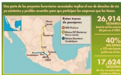
MAPA PLAN FERROVIARIO PARA PASAJEROS, Zacatecas desplazado

Para el próximo gobierno federal, Zacatecas no tiene obras magnas consideradas, ni en el plan hídrico, porque la presa "Milpillás" sólo ha sido discurso de campaña, ni en el ferrocarril y mucho menos en carreteras, donde la situación se encuentra en estado de coma y, a tres años de gestión, seguimos esperando el plan de desarrollo económico de Zacatecas.