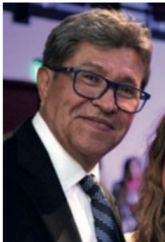
Ricardo Monreal Ávila