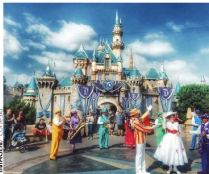
THE WALT DISNEY COMPANY es el único diseñado bajo la supervisión del productor y cineasta Walt Disney.

A lo largo de mi vida he podido visitar en varias ocasiones los parques de California y Florida donde creame, disfruto cada momento como el primer día