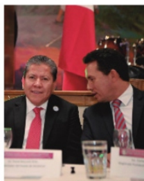
EL GOBERNADOR Y EL PRESIDENTE DEL TSJEZ presentes en Illinois