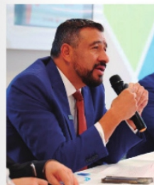
EL SECRETARIO DE ECONOMÍA, sigue sin dar resultados.

La zona beneficiada según el proyecto que se trabaja en momento en la Secretaría se encuentran 172 establecimientos, entre ellos comercios, bancos, laboratorios, agencias automotrices y hoteles, y a los apoyos se les denominan "empleos por la Paz", contemplan estímulos fiscales en el Impuesto Sobre Nómina, que habría reducción o exención de impuestos