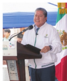
DAVID MONREAL, gobernador.

Las mágicas palabras que ayer expresó el gobernador de Zacatecas, David Monreal