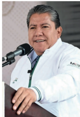
David Monreal Ávila