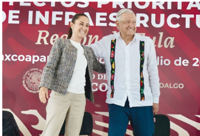
Claudia Sheinbaum Pardo y Andrés Manuel López Obrador