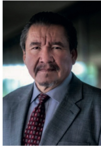
Rodolfo Monreal Avila

“ASÍ las cosas, hablar de Fresnillo es hablar del ‘Monrealato’, la mano que mece la cuna de la inseguridad, pues la violencia se afianzó con Rodolfo Monreal Ávila, presidente municipal de Fresnillo (2004-2007), con quien el narco comenzó a echar raíces en todo su territorio y se consolidó con David Monreal Avila (2007-2010), coronándose como la ciudad más peligrosa de México, con el reelecto alcalde Saúl Monreal Ávila (2018-2021 y 2021-2024).