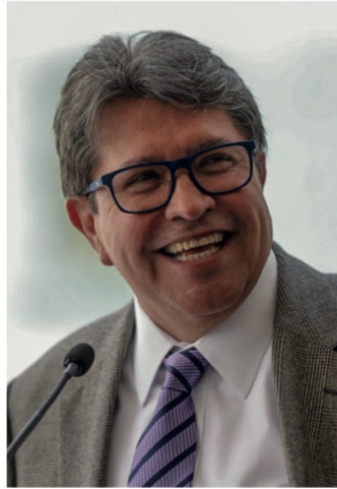
Ricardo Monreal Avila