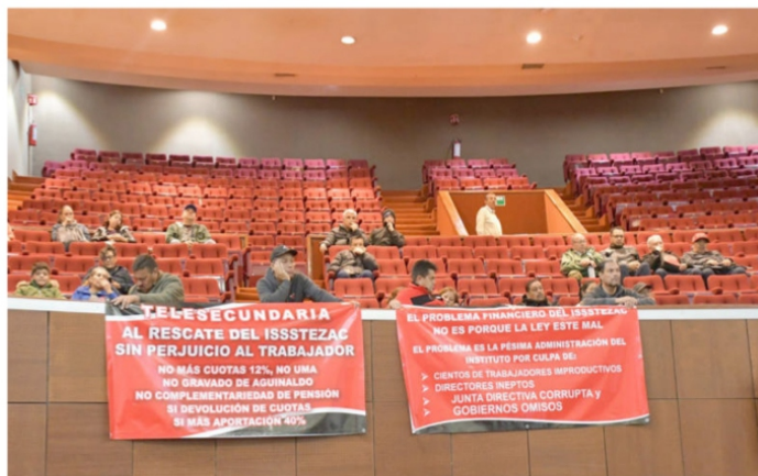
“El problema financiero del Issstetzac, no es porque la ley esté mal, sino por la pésima administración del Instituto, cientos de trabajadores improductivos, directores corruptos y gobiernos omisos”