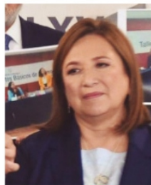
XÓCHITL GÁLVEZ, estará en Zacatecas.

Una vez que se apruebe la nueva Ley del Issstezac, saldrán varios nombres de figuras políticas de primer nivel, de todos los partidos, que están en la lista de 740 solicitantes de la aprobación de su jubilación en el organismo. La negativa de esa "clase política" a la reforma, es que podrían perder muchos de los beneficios, que, dicen, tienen ganados por su "servicio a los zacatecanos". Algunas sorpresas hay en la relación de nombres.