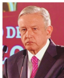
AMLO, Presentó el Plan C en febrero.

La Comisión de Puntos Constitucionales adelantó que el 1 de agosto dictaminará las iniciativas de reformas constitucionales que el presidente Andrés Manuel López Obrador presentó el 5 de febrero, llamado Plan C, y que incluye la reforma al Poder Judicial que contempla la elección de jueces y magistrados por voto popular.