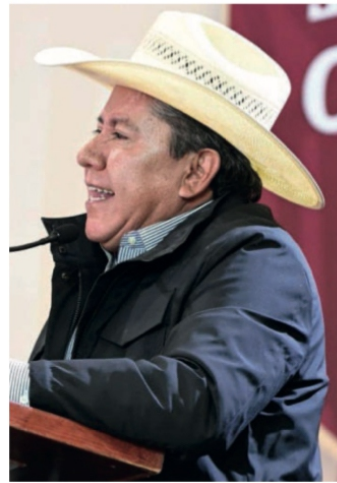
David Monreal Ávila