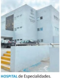
HOSPITAL de Especialidades.

DEFIENDE MORENA PLAN DE MOVILIDAD ALEJANDRO WONG METRÓPOLI A4