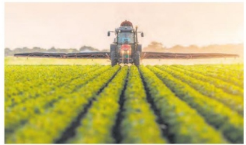
SE OTORGARON apoyos a 4 mil productores.

Secampo considera que es un buen temporal y los agricultores piden más apoyos, tras dos años de sequía