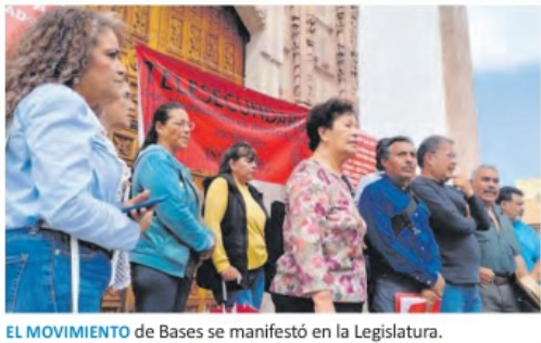
EL MOVIMIENTO de Bases se manifestó en la Legislatura.

nifestaron en la explanada del Congreso para mostrar su rechazo a la resolución del informe presentado el lunes, según el cual se concluye como necesaria la reforma, aun cuando ignora las propuestas de los trabajadores. METRÓPOLI A4