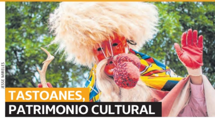
TASTOANES, PATRIMONIO CULTURAL

La afectada promovió un amparo en el Poder Judicial de la Federación (PJF) para que la institución le pague los gastos. Por su parte, fuentes oficiales del centro médico aseguraron que el problema sería resuelto a la brevedad, pues estaba en trámite la compra del medicamento para la atención de los pacientes que lo requieran. Aseguraron que solo fueron dos pacientes afectados y no se suspendió el servicio de quimioterapias. METRÓPOLI A2