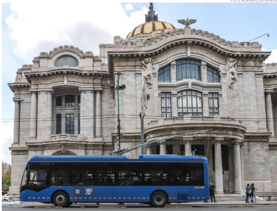
Un trolebús del modelo que se implementó para Ciudad de México.