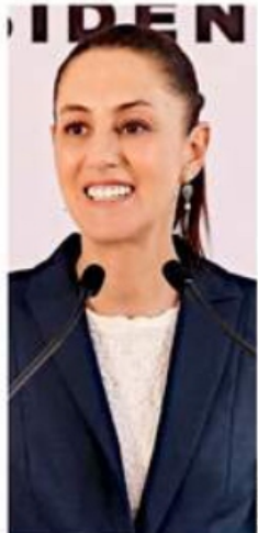
Sheinbaum, ayer en su conferencia matutina.

"Les puedo decir con toda claridad que las finanzas