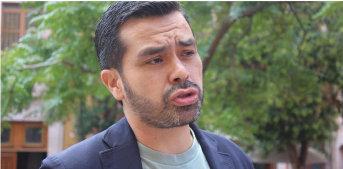
Jorge Álvarez Máynez, excandidato a la presidencia de México