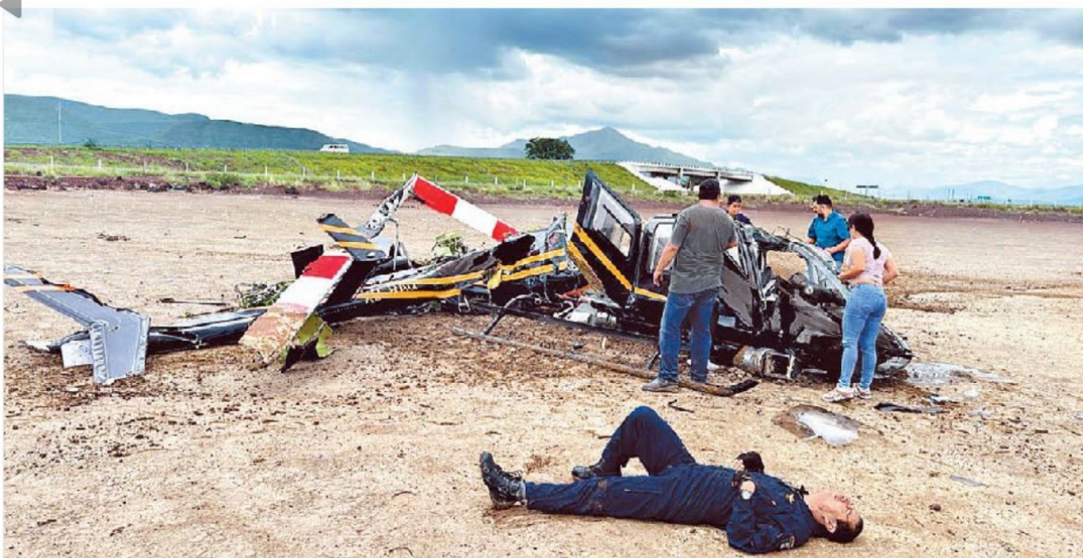
Cuatro personas sobrevivieron al desplome de un helicóptero en Jalisco y fueron llevadas a un hospital de Sayula. ESPECIAL P. 16 Y 17