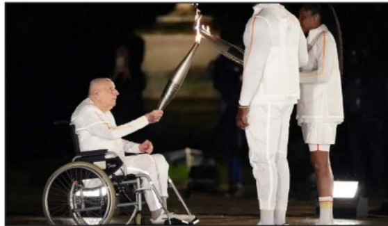
La fiesta deportiva inició en la Ciudad del Amor con los Juegos Olímpicos de París 2024, un evento que albergará la capital de Francia por dos semanas; una justa que estará siendo oficialmente inaugurada en la ceremonia de apertura.