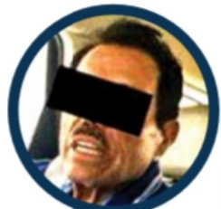
El gobierno federal difundió fotos de Guzmán y Zambada capturados.