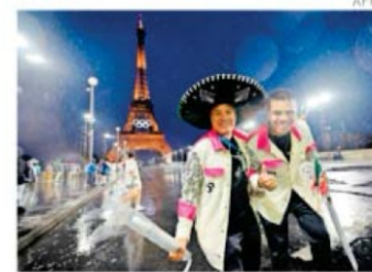
Integrantes de la delegación luego de desfilan en una embarcación