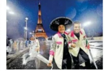
Integrantes de la delegación mexicana luego de desfilan en una embarcación