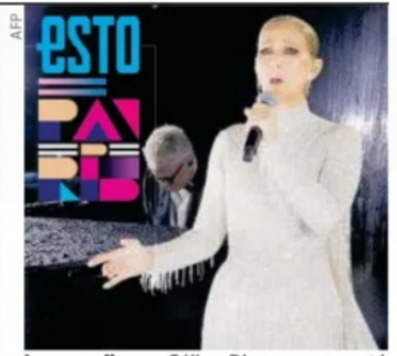
La canadiense Céline Dion se presentó en lo alto de la Torre Eiffel

París mostró todo su esplendor en la ceremonia inaugural de los Juegos Olímpicos, celebrada a lo largo del Río Sena, y en la que participaron atletas históricos como Nadia Comaneci, Carl Lewis, Serena Williams y Rafa Nadal, además del espectáculo de Marc Cerrone y Lady Gaga. El evento duró más de cuatro horas.