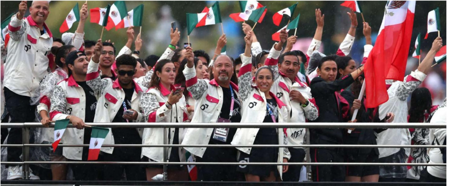
La delegación mexicana navega sobre el Sena, en la apertura de la Olimpiadas de París; como es costumbre, los mexicanos que viajaron a Francia fueron de los más emocionados y ruidosos en la celebración en el inicio de los Juegos. Todo ha resultado tan espectacular como se esperaba. PAG 22 y 23