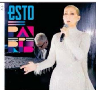
La canadiense Céline Dion se presentó en lo alto de la Torre Eiffel

Paris mostró todo su esplendor en la ceremonia inaugural de los Juegos Olímpicos, celebrada a lo largo del Río Sena, y en la que participaron atletas históricos como Nadia Comaneci, Carl Lewis, Serena Williams y Rafa Nadal, además del espectáculo de Céline Dion y Lady Gaga. El evento duró más de cuatro horas.