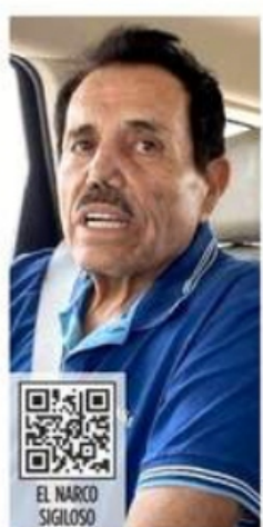
Ismael "El Mayo" Zambada, tras ser detenido.

agentes estadounidenses dudaron cuando Guzmán López les dijo que trabajaría con ellos para facilitar la captura del "Mayo".