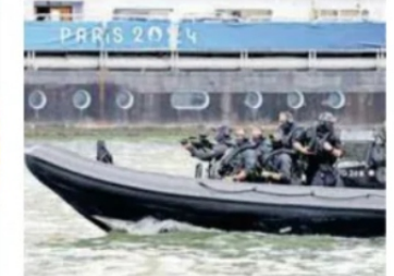
Fuerzas especiales de seguridad resguardaron el desfile en el Río Sena

CIUDAD DE MÉXICO | SÁBADO 27 DE JULIO DE 2024 | AÑO LIX | NO. 21,184 | ORGANIZACIÓN EDITORIAL MEXICANA