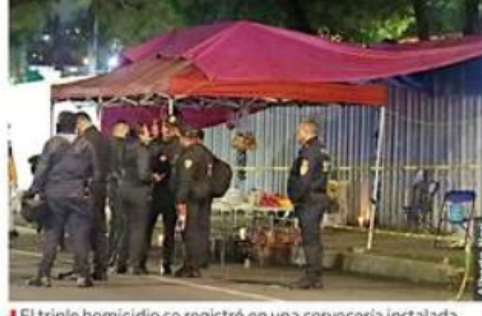
El triple homicidio se registró en una cervecería instalada en la Calle Manuela Medina.

En un video que fue publicado en redes sociales se ve a las víctimas tendidas en una banqueta. Las personas asesinadas tenían entre