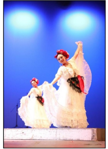
El Ballet Folclórico "Gustavo Vaquera Contreras", perteneciente a la Secretaría de Educación de Zacatecas (Seduzac), cumplió 29 años de proyectar la cultura de Zacatecas y de México, a través de la danza.