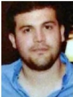
ISMAEL Zambada y Joaquín Guzmán.