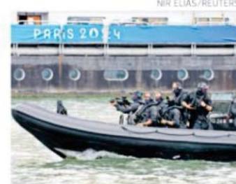
Fuerzas especiales de seguridad resguardaron el desfile en el Río Sena