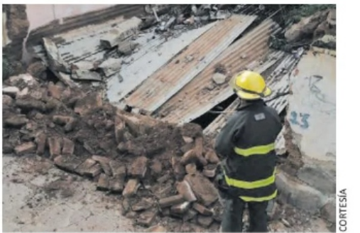
REALIZAN un reporte de daños.

albergue y la Secretaría de Salud envió una brigada médica para atender a la población afectada.