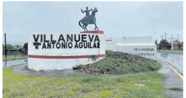
MONUMENTO a Antonio Aguilar.

Fuentes oficiales confirmaron el hallazgo poco antes de las 7 horas de este viernes. Tres de las víctimas estaban en la glorieta del monumento a Antonio Aguilar, junto con el cartelón. Las otras dos se encontraban a pocos metros, a un costado del camino.