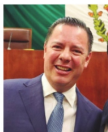
RAÚL BRITO, auditor Superior del Estado.

En el periodo revisado por el equipo de Raúl Brito Berumen abarca del primero de enero del 2010 al 31 de enero del 2020, y saltan nombres de todos aquellos servidores