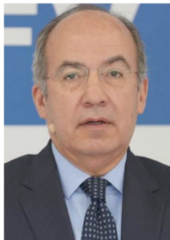
Felipe Calderón Hinojosa