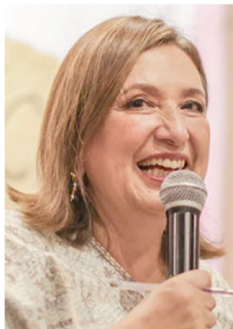
Xóchitl Gálvez Ruiz