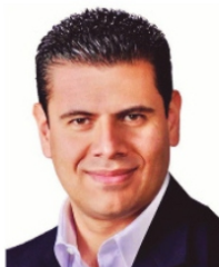
MIGUEL ALONSO , ex Gobernador.

Ortiz , es el senador electo Saúl Monreal Ávila , quien además está acordando con los migrantes la agenda política que llevará desde el primero de septiembre al Senado de la República. Dice que ahora los migrantes marcharán acompañados en el Senado.