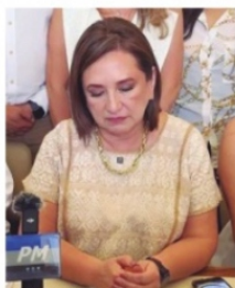
XÓCHITL GÁLVEZ , senadora.