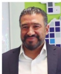
RODRIGO CASTAÑEDA , secretario de Economía.

Competitividad A.C (IMCO), y no se refleja con inversiones en áreas del medio ambiente, mercado de trabajo, economía, infraestructura, apertura internacional e innovación, seguimos lejos y eso no lo ven en el gobierno. Se refleja en la estadística del IMSS que son los datos que verdaderamente valen para saber cómo ha decrecido la entidad.