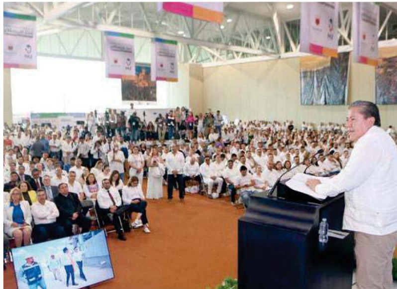
El mandatario estatal informó a la sociedad sobre los resultados de los -primeros seis meses de la agenda por la paz 2024-.

Cuatro temas relevantes para Zacatecas, -un estado tan pequeño- que están en la agenda de la discusión pública. Todos ellos relevantes y de un gran impacto político, económico y social para la entidad