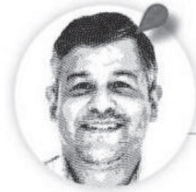
Rodrigo Sandoval Almazán

Con sensibilidad, respetuoso de la separación de poderes y con reiteración sobre la autonomía e independencia del Poder Judicial, sutileza y certeza se manifestaron en las opiniones del Tribunal Superior de Justicia del Estado y su Presidente, actitud prudente y de claro posicionamiento, una ruta armonizadora y conciliadora, la que contrasta con las descalificaciones y exclusiones que se lanzan desde los legisladores de los partidos en el poder, que van de hecho a cumplir con la estrategia de reforma integral al Poder Judicial.