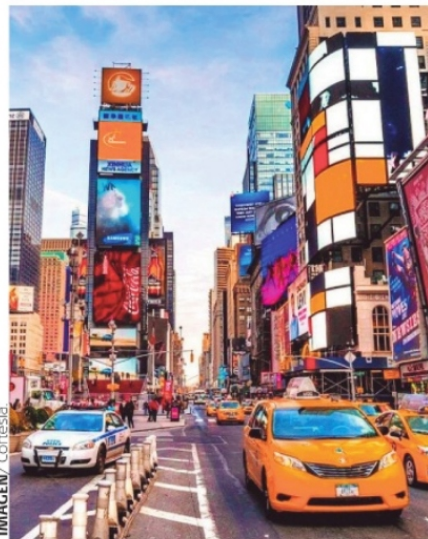
NUEVA YORK Y SU FAMOSA TIMES SQUARE lugar de Estados Unidos recomendado en todas las guías turísticas.

Los mercados locales lucen atiborrados de vi-