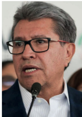
Ricardo Monreal Ávila