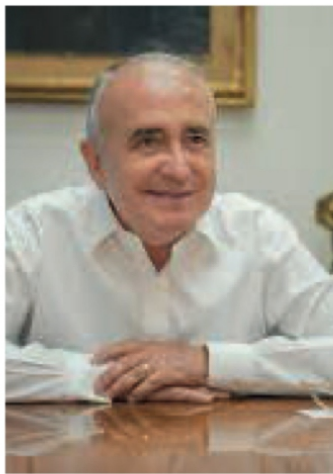
Pedro Ferriz de Con