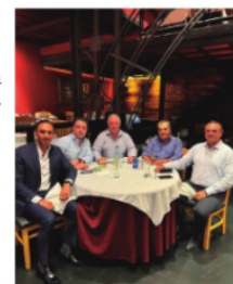
EMPRESARIOS ZACATECANOS, se reunieron.

Este lunes comienza el ciclo escolar 2024-2025 y la Secretaría de Educación ya se realizó la fase intensiva y sesión ordinaria del Consejo Técnico Escolar (CTE), en la que participaron todas y todos los maestros de los 58 municipios de Zacatecas. Comienza un nuevo año para los niños y niñas de la entidad y ojalá que las autoridades estén a la altura de lo que requiere la educación e Zacatecas