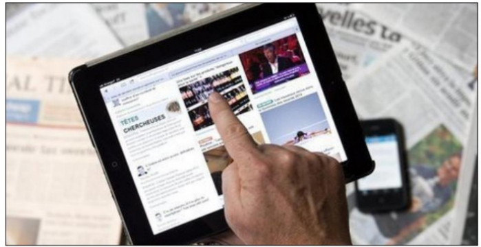
La proliferación de medios de comunicación digitales ha venido a trastornar severamente el porvenir de la prensa impresa: sus lectores se han trasladado a las pantallas digitales.

Los docentes se enfrentan a una carga administrativa excesiva, ello hace que descuide la actividad académica, misma que es la esencia de su función profesional, si a ello le agregamos la falta de proyectos de actualización y profesionalización, la actividad se empobrece todavía más. A lo más que ha llegado la SEP, es a ofertar cursos, mismos que no llevan otra intención más que instruir y formatear a los maestros, bajo estas condiciones, no se experimentará jamás una transformación educativa. ■