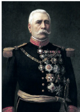
Porfirio Díaz Mori