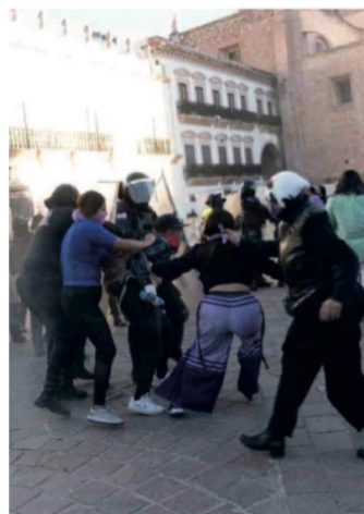
8 de marzo no se olvida

más dinero en mis negocios que como Presidente de México-.