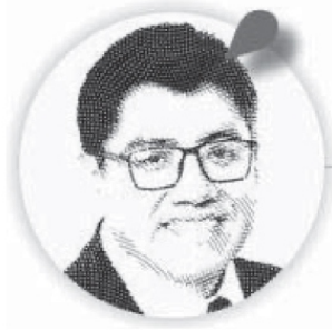
Saúl Monreal Ávila