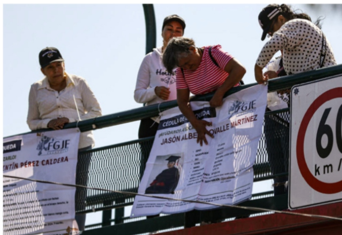
¿Dónde, dónde están?

14 años; el chavo salió en libertad y fue deportado a Estados Unidos, donde nació; desde entonces no se sabe nada de él-.