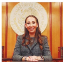
NOEMÍ LUNA, diputada federal.

Alrededor de 700 trabajadores del Poder Judicial de la Federación (PJF), portando veladoras, realizaron una manifestación de carácter fúnebre, para protestar por lo que ellos mismos denominaron "el asesinato de la justicia en México". Los manifestantes indicaron que dentro y fuera del país existe un elevado grado de conciencia sobre la importancia de "no permitir que en México se asesine a la justicia".