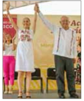
El Presidente y la mandataria electa visitaron Manzanillo.

gobierno estatal no han logrado retirar un tapón de basura que obstruye el desagüe del colector Solidaridad. En tanto, en Valle de Aragón, en Ecatepec, ayer se abrió un socavón de unos 8 metros de diámetro. RENÉ RAMÓN Y JAVIER SALINAS, CORRESPONSALES / P 26