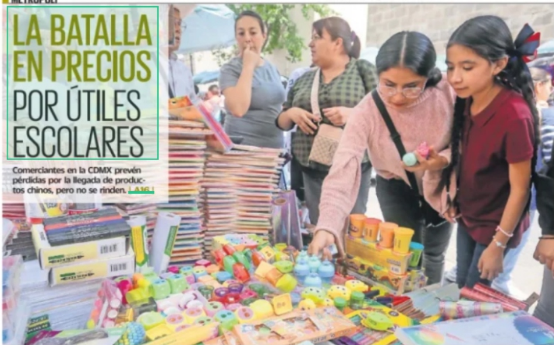
LUIS CAMACHO, EL UNIVERSAL

Comerciantes en la CDMX prevén pérdidas por la llegada de productos chinos, pero no se rinden. | A16 |