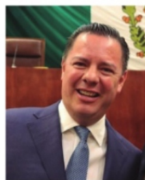
RAUL BRITO, auditor Superior del Estado.

para que aclaren su situación, y sobresalen particularmente las unidades de Medicina, Odontología, Contaduría y Administración y especialmente la Unidad Académica de Derecho, donde hay muchos funcionarios públicos que no cumplen con los requisitos legales para cumplir en ambas partes. Por