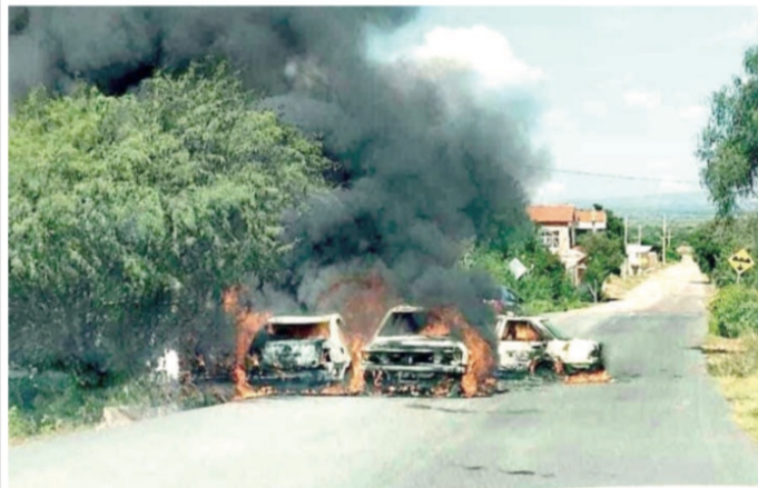
En las comunidades de Nigromante en Pinos, dejaron vehículos incendiados, así como en la comunidad El Lobo, en Loreto