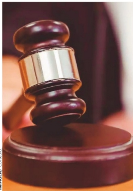
IMAGEN/ Cortesia LA ELECCIÓN DE JUECES por medio del voto popular solo beneficia a la clase política con poder dominante.

Esta iniciativa contiene también un tribunal de disciplina con el que se corre el riesgo de que se pueda utilizar para censurar la opinión