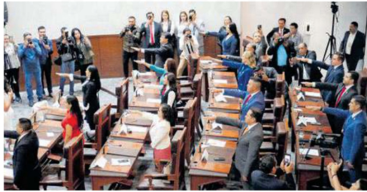
En la LXV legislatura del estado de Zacatecas, los 30 nuevos diputados rindieron protesta.

La recién llegada LXV Legislatura del Estado tendrá que emitir una convocatoria para que el IEEZ realice elecciones extraordinarias antes de que termine 2024.