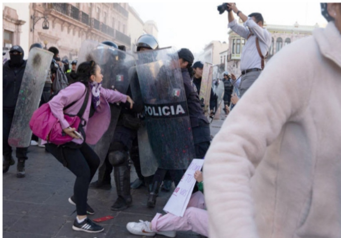
Policías agrediendo a mujeres feministas el 8M