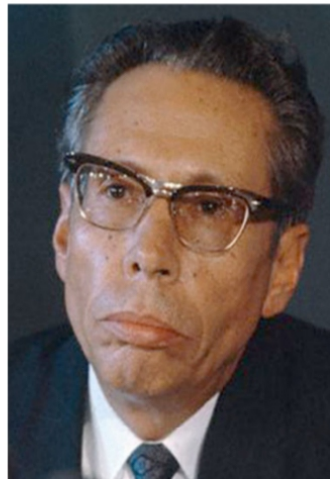
Gustavo Díaz Ordaz