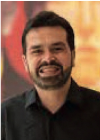
Jorge Álvarez Máynez