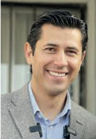
Julio César Chávez Padilla