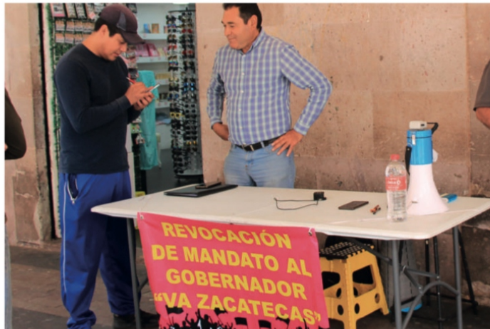
Inician recolección de firmas para Revocación de Mandato