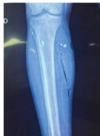
RADIOGRAFÍA en la que se muestran pequeños fragmentos metálicos.

En síntesis, las personas atendidas por la explosión de la Fenaza presentan heridas causadas por esquirlas, no por quemaduras, lo que aleja aún más la teoría de la explosión por acumulación de gas.