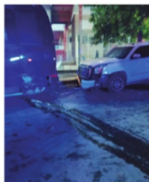
VEHÍCULOS OFICIALES , la suburban es del fiscal.