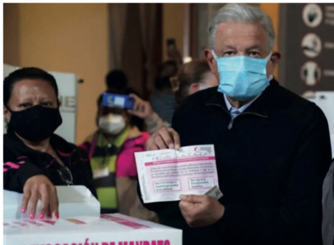
En 2022, López Obrador ganó la Revocación de Mandato

‘LAS AUTORIDADES estatales trataron de minimizar el atentado asegurando que se trató de un estallido por una fuga de gas en un puesto de comida ambulante y amenazó a los involucrados a no emitir ninguna declaración a los medios de comunicación sobre lo que realmente sucedió.