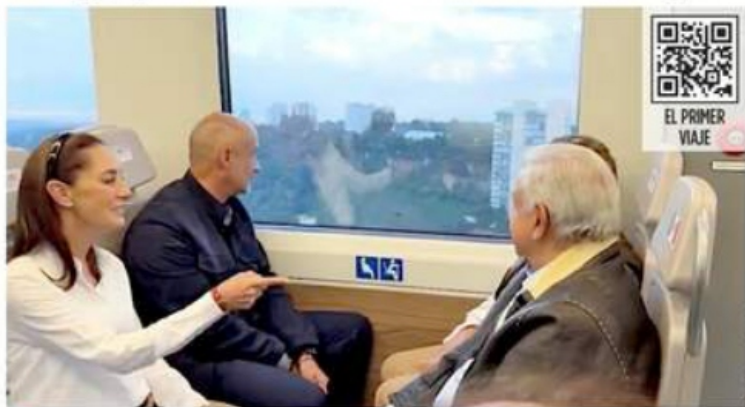
López Obrador hizo el primer viaje junto con la Presidente electa, Claudia Sheinbaum.