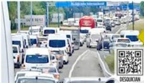
Las protestas afectaron a los viajeros que iban al aeropuerto.