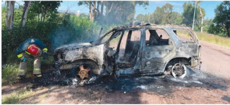
FUERON SEIS los vehículos quemados por los bloqueos carreteros.

STAFF Una emboscada a policías estatales, balaceras y bloqueos carreteros se registraron en municipios del sureste. El saldo fue de un elemento de seguridad y cinco presuntos delincuentes muertos, además de otros dos agentes heridos y una persona detenida. La mañana de este sábado, habitantes reportaron detonaciones de arma de fuego en distintos puntos de aquella región. De acuerdo con la Vocería de la Mesa Estatal de Construcción de Paz, todo comenzó en Ignacio Zaragoza, Villa García.