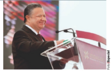
EL GOBERNADOR, ayer, durante su informe.

En 2019 fue liberado y se convirtió en testigo clave del caso bajo el alias de Juan ; en 2020 señaló a mandos del Ejército con la desaparición de normalistas, pero nunca aportó pruebas