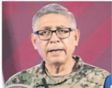
Con un perfil más administrativo que operativo, el almirante Raymundo Morales encabezará la Marina.