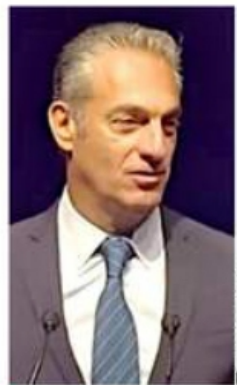
Carlos Slim Domit, ayer en el foro con becarios.

"Con unidad nacional y Estado de derecho, estas dinámicas tienen un potencial enorme para generar un crecimiento fuerte y sostenido", afirmó.