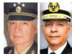
General Ricardo Trevilla Trejo and Almirante Raymundo Morales.

Ambos han tenido una carrera común. Sandoval ascendió como General de División en 2017 y Trevilla en 2021. Los dos provienen de la División de Caballería.