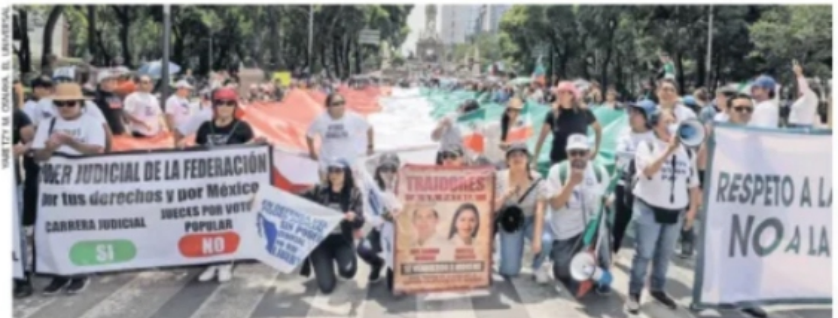
Con el despliegue de la Bandera Nacional, opositores a la reforma judicial marcharon hacia el Senado.