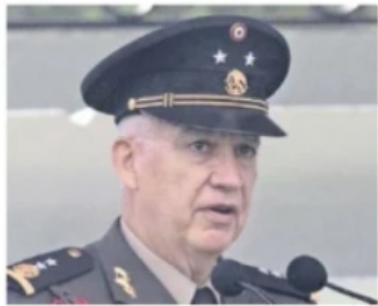
El general Ricardo Trevilla, próximo secretario de la Defensa, es cercano al actual titular del Ejército.