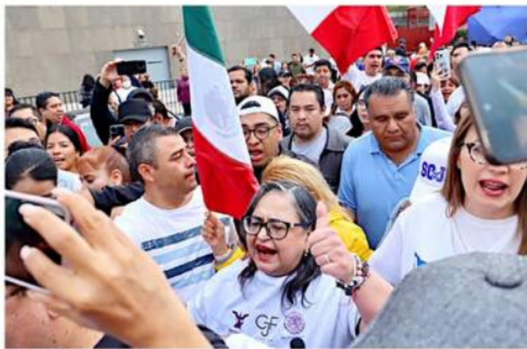
'NO VA A CAER!'. Como sus pares y antagonistas, Lenia Batres y Loretta Ortiz (quienes encabezaron un mitin el jueves pasado), la titular de la Corte, Norma Piña, salió a la calle ayer a arengar a los trabajadores del Poder Judicial que desde el martes bloquean la Cámara de Diputados. Gritó con ellos, con el puño en alto: "¡El Poder Judicial no va a caer!".

"Desde la primera sesión de la Comisión de Puntos Constitucionales nosotros pedimos más tiempo. ¿Qué urgencia hay? Los legisladores apenas están entrando. No han tenido la oportunidad ni siquiera de conocer el dictamen. Hay que tener un