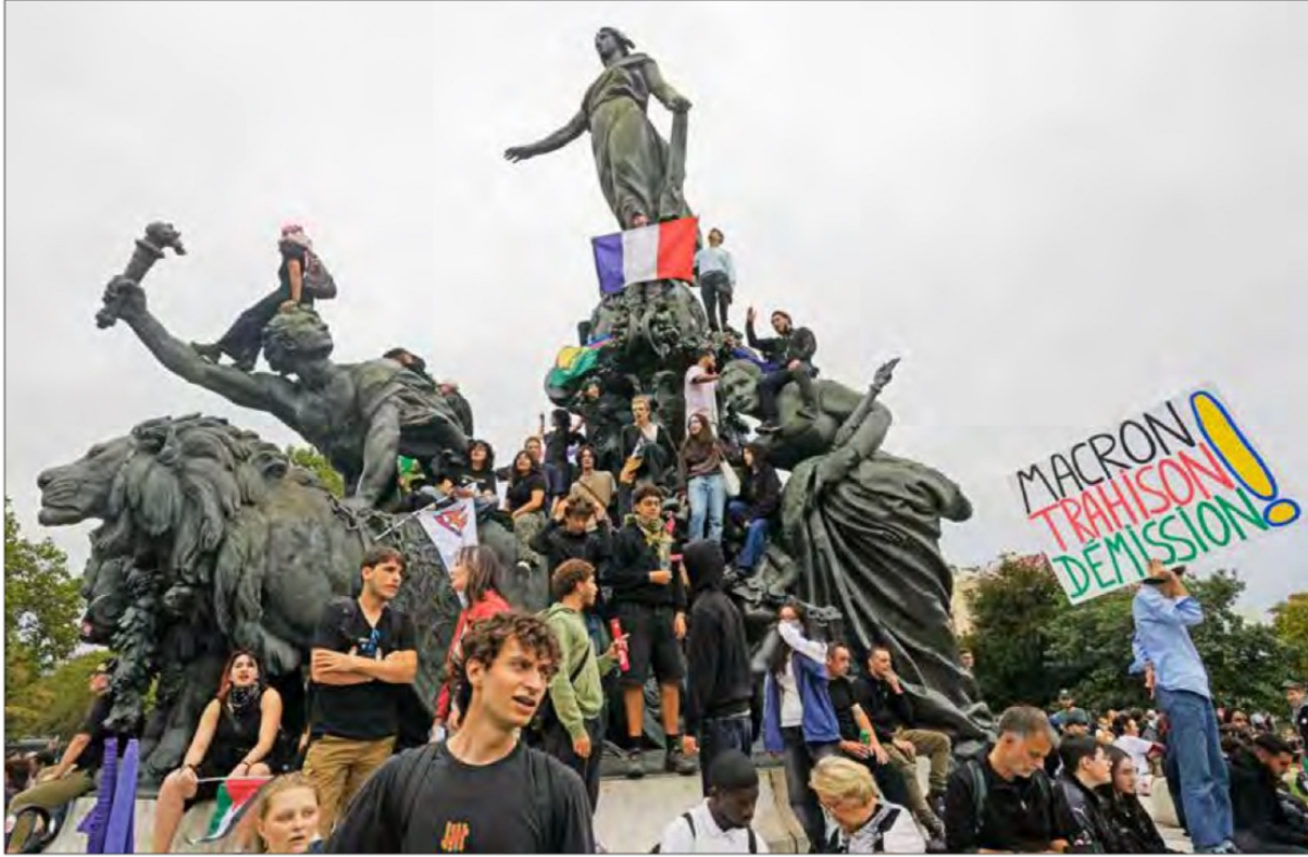
▲ Ciudadanos inconformes salieron a las calles en todo el país para protestar contra el nombramiento del centroderechista Michel Barnier como primer ministro, aun cuando en la pasada elección la izquierda