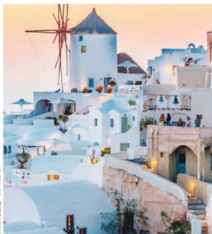
SANTORINI La belleza de sus ciudades se caracteriza por estrechos callejones donde casas blancas hacen de este lugar un encantador espacio.

Otra de las islas más emblemáticas de Grecia es Santorini, siendo este un archipiélago circular formado por islas volcánicas. Su nombre actual es de origen italiano y se debe a los mercaderes venecianos medievales que le llamaron Santa Irene en italiano, en honor a la patrona de la isla Santa Irene de Tesalónica. Este nombre se conserva y evoluciona en Santo Rini, luego Santorini.