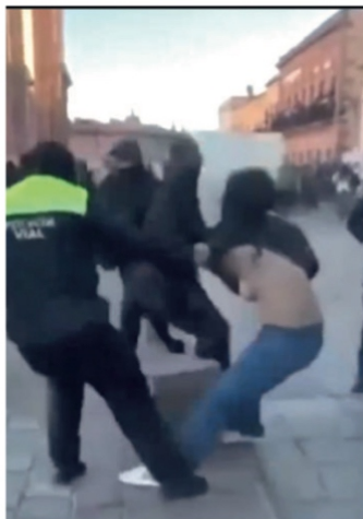
“8 de marzo no se olvida”