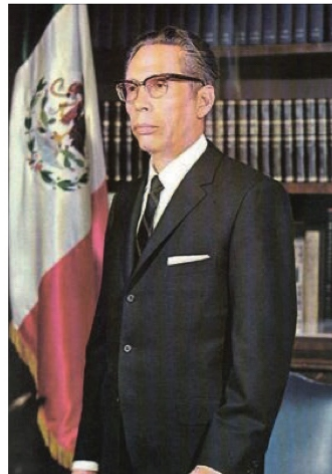
Gustavo Díaz Ordaz