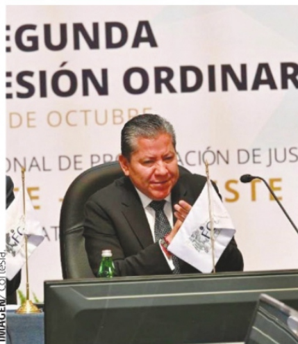
SEGUNDA SESIÓN ORDINARIA 2024 de las zonas noreste y noroeste de la Conferencia Nacional de Procuración de Justicia.

Se juntaron en la capital todos los fiscales de los estados del norte de nuestro país, territorios que sin