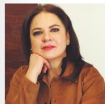
JULIETA DEL RÍO , comisionada del INAI.

Luego de la reunión entre los comisionados del Instituto Nacional de Transparencia (INAI) y la secretaria de Gobernación, Rosa Isela Rodríguez , en el órgano de transparencia mantienen la esperanza de salvar al organismo. La reunión fue un avance importante, ya que es la primera vez que los comisionados fueron recibidos tras varios intentos.