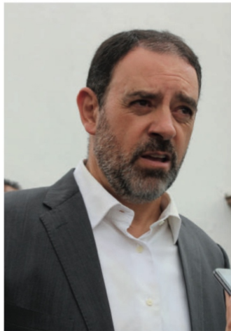
Alejandro Tello Cristera