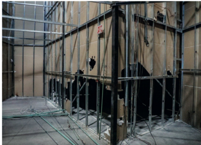
Vandalizaron el antro La Reina (Gobierno del Estado de Zacatecas)