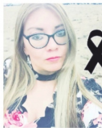
ANGÉLICA víctima de feminicidio

En la sección 34 del SNTE está a punto de desbordarse la contienda, donde ya se reúnen todas las fuerzas opositoras para encontrar la unidad y convertir una planilla de unidad, en una seria opción para derrocar a la "cacique" de ocho años. Esta semana será crucial en esa tarea.