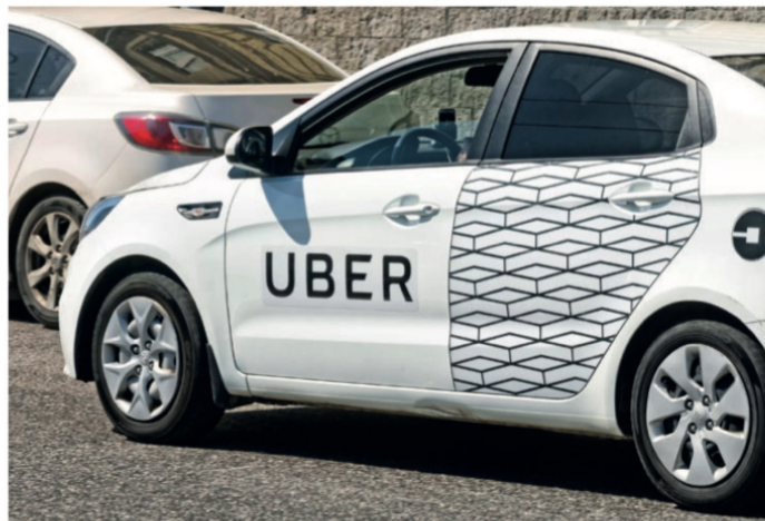
Un carro y celular y listo- ¡A tronar taxistas!