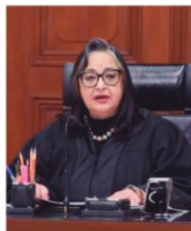
NORMA PIÑA , ministra presidenta de la SCJN.

En medio de los recientes cambios en el Poder Judicial de México, se ha informado que siete de los once ministros de la Suprema Corte de Justicia de la Nación (SCJN) presentarán su renuncia este martes 29 de octubre, aunque esta decisión no será efectiva hasta agosto de 2025. De ser así, únicamente cuatro ministras permanecerán en el máximo tribunal del país: la ministra presidenta Norma Piña, junto con Loretta Ortiz Ahlf, Yasmin Esquivel Mossa y Lenia Batres. Entre los ministros que renunciarán están Ana Margarita Ríos Farjat, Juan Luis González Alcántara Carrancá,