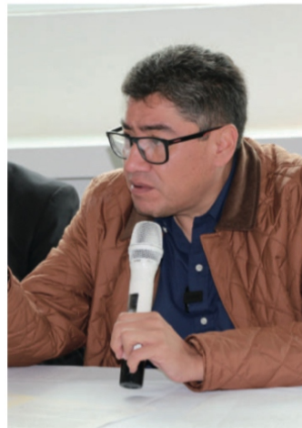
Saúl Monreal Ávila