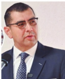
CRISTIAN CAMACHO , Fiscal.

competentes y comparezca al proceso penal iniciado en su contra, en defensa de sus derechos. A partir de la aprobación del dictamen, también quedaría separado del cargo. Será el segundo alcalde en 18 meses al que le quitan la inmunidad constitucional y lo separan del cargo, esperando que este sí lo puedan atrapar.