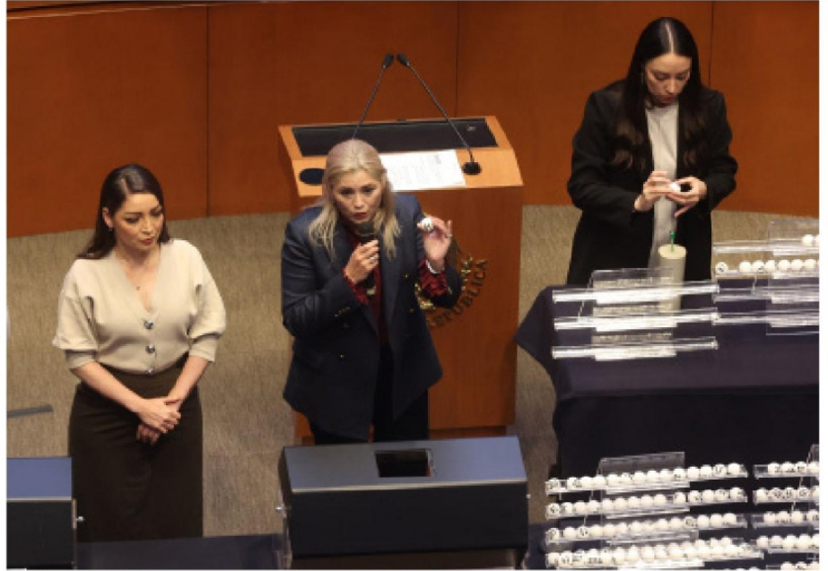
Escena durante la tómbola para determinar puestos de administración de justicia que irá a elección popular