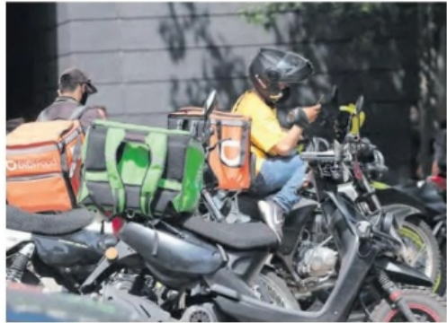
REFORMA MAYOR protección laboral y flexibilidad, el debate entre los colaboradores.

El estudiante de ingeniería en Mecatrónica y repartidor de fin de semana enfatizó su desinterés en la implementación de seguridad social: "no es un trabajo curricular, ni siquiera me sirve para poder avanzar laboralmente. El que delimiten el salario mínimo limita nuestras tarifas y oportunidades