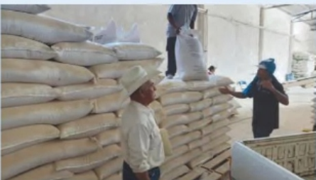
CORTESÍA EN LOS almacenes también se atenderá a los productores para el Bienestar.

VILLANUEVA ■ Reto, recuperar confianza para turismo: Medina A3