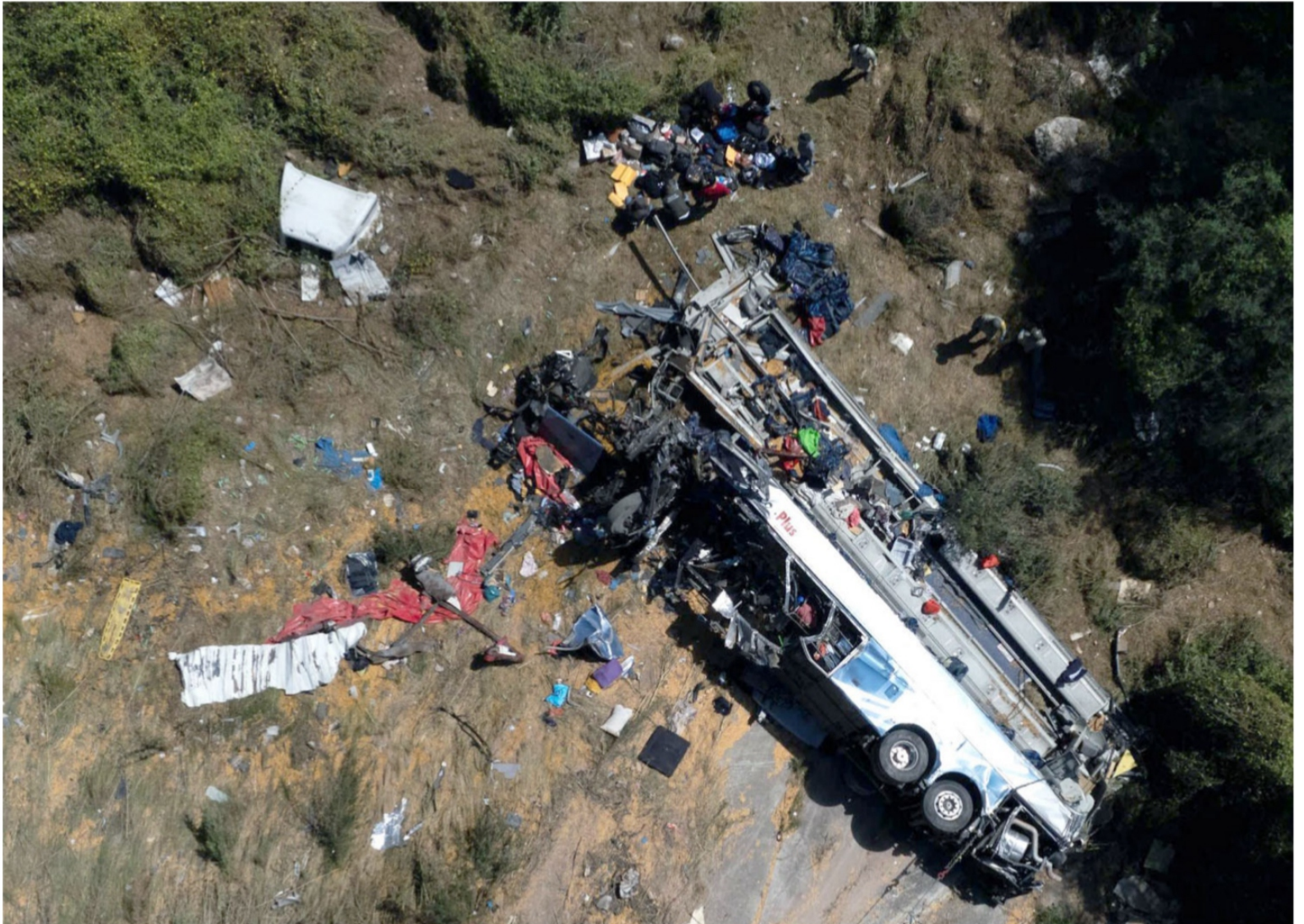
Cuauhtémoc, Zacatecas.- La madrugada de este sábado se registró un choque entre un tractocamión y un autobús, el cual se desbarrancó, sobre la carretera federal 45, cerca de la caseta Osiris-Aguascalientes, que dejó un saldo de 19 personas muertas y seis heridas