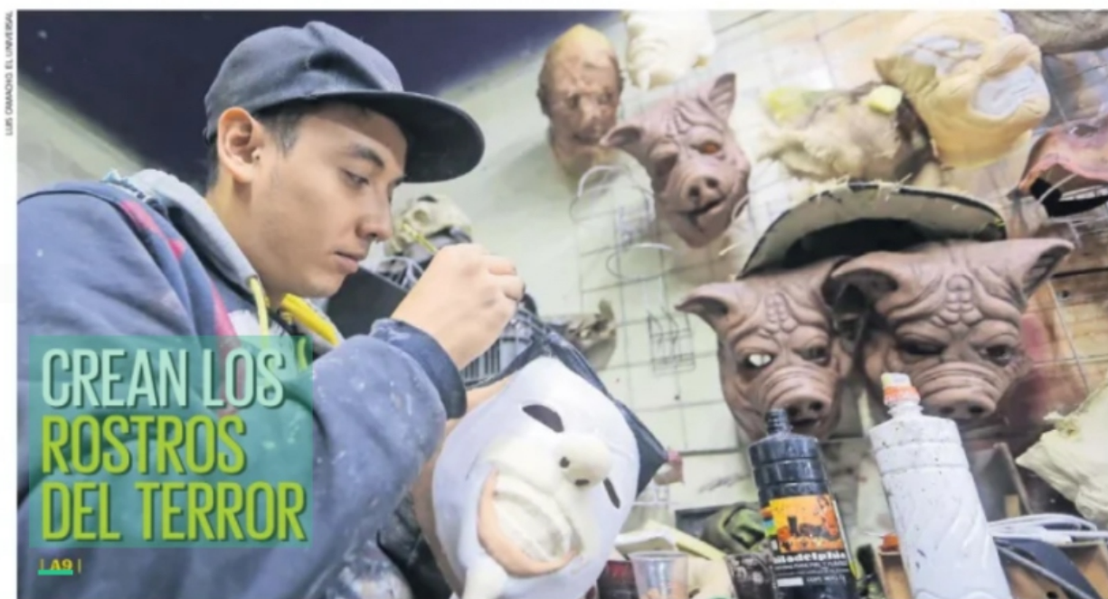
LUIS DOMÍNGUEZ, EL UNIVERSAL