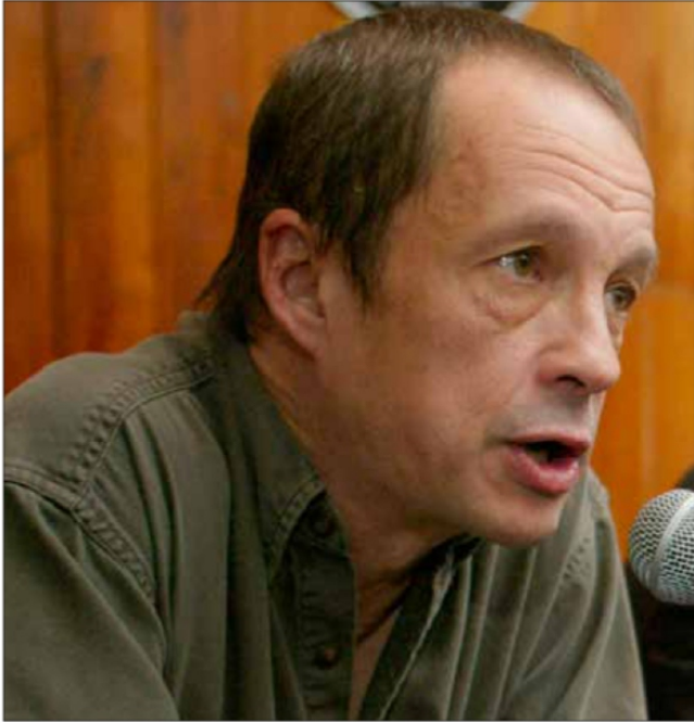
▲ El columnista, escritor y fundador de La Jornada fue homenajeado con motivo del 70 aniversario de su