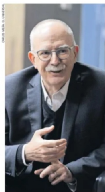
CARLOS MEYER, EL UNIVERSAL