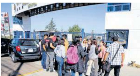
EL SOL DE ZACATECAS