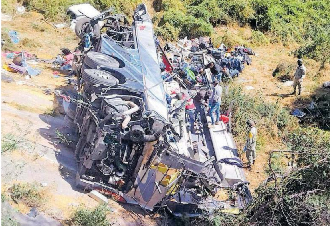
El accidente de un autobús de pasajeros ocurrido en la madrugada de este sábado en la autopista Aguascalientes – Zacatecas