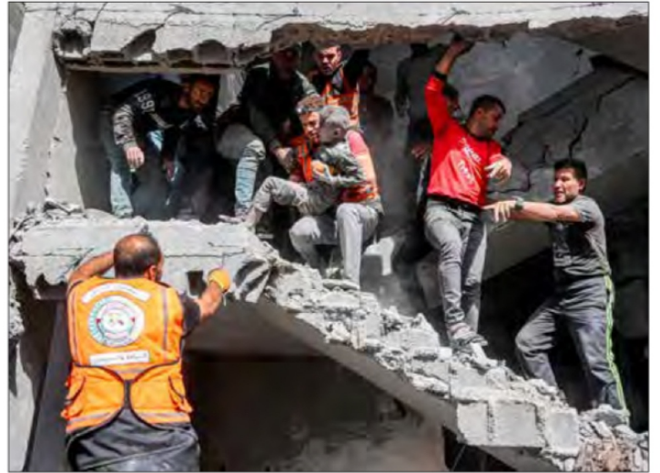
▲ Bombardeo en zonas residenciales de Beit Lahiya dejó 45 muertos. En la imagen, rescate de un niño en la ciudad de Gaza. / P 16 Y 17

MIREYA CUÉLLAR, CORRESPONSAL, Y FABIOLA MARTÍNEZ / P 3