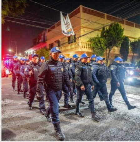
Autoridades capitalinas procedieron a quitar chelerías de vía pública y suspendieron el servicio en bares por irregularidad en permisos. PAG 10