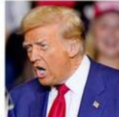
Donald Trump, ayer en un acto de campaña