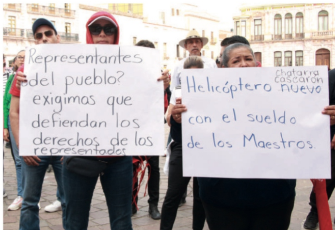
Compró Helicóptero chatarra con el sueldo de los maestros