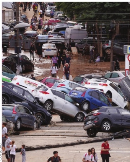
LAS LLUVIAS EXCESIVAS provocaron inundaciones en Valencia, España.

Creo cualquier época del año es buena para visitar esta ciudad, en lo particular la mejor temperatura para nosotros la tendrá al comienzo de la primavera cuando el calor no es tan fuerte. El día especial para no