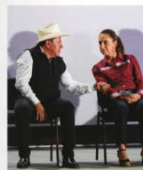
CLAUDIA SHEINBAUM, Presidenta de México.

en Guadalupe. Son muchas las quejas por la ineficacia en la transición de los trabajadores de la Secretaría de Salud estatal al programa IMSS-Bienestar, así como la falta de medicamentos que permita satisfacer las necesidades de la población abierta de la entidad.