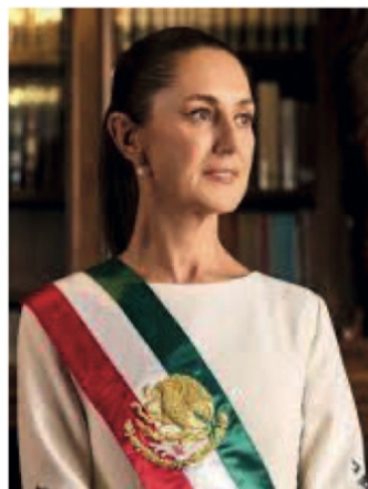
Claudia Sheinbaum Pardo

El miércoles 13, el gobierno monrealista dio a conocer a los zacatecanos, un asesinato, pero no fue uno sino dos los cometidos como lo reporta el Gobierno de México en su informe diario