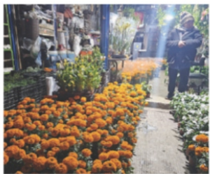
VENTA de la planta, ayer en la Ceda.

ANALIZAN , tras inundación y pérdidas, si la siguen sembrando o si invierten menos; se encarece planta. pág. 17