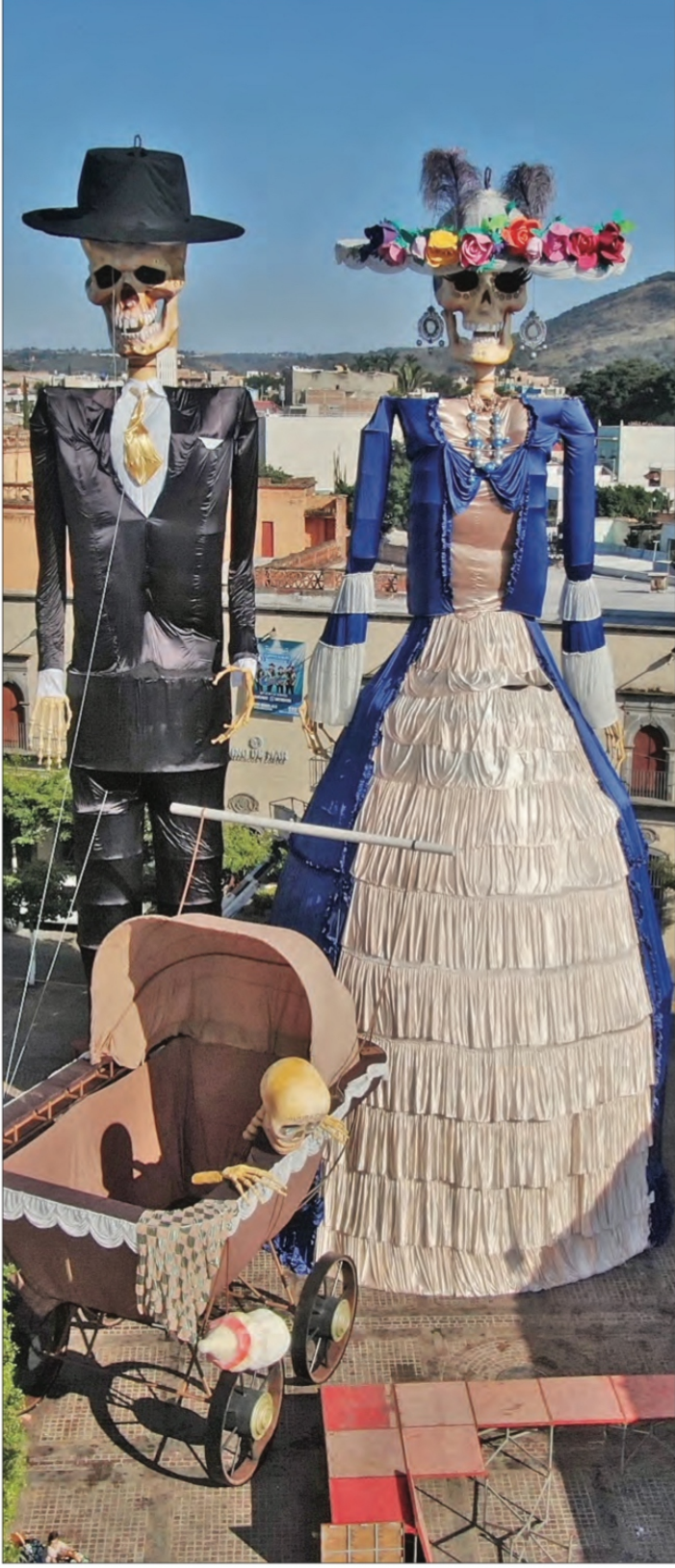
▲ La conmemoración, en todo el país este fin de semana. En la imagen, esculturas monumentales en Zapotlanejo, Jalisco. REDACCIÓN/CULTURA