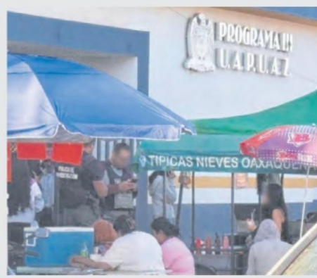
HOMBRES armados se los llevaron del exterior del plantel.