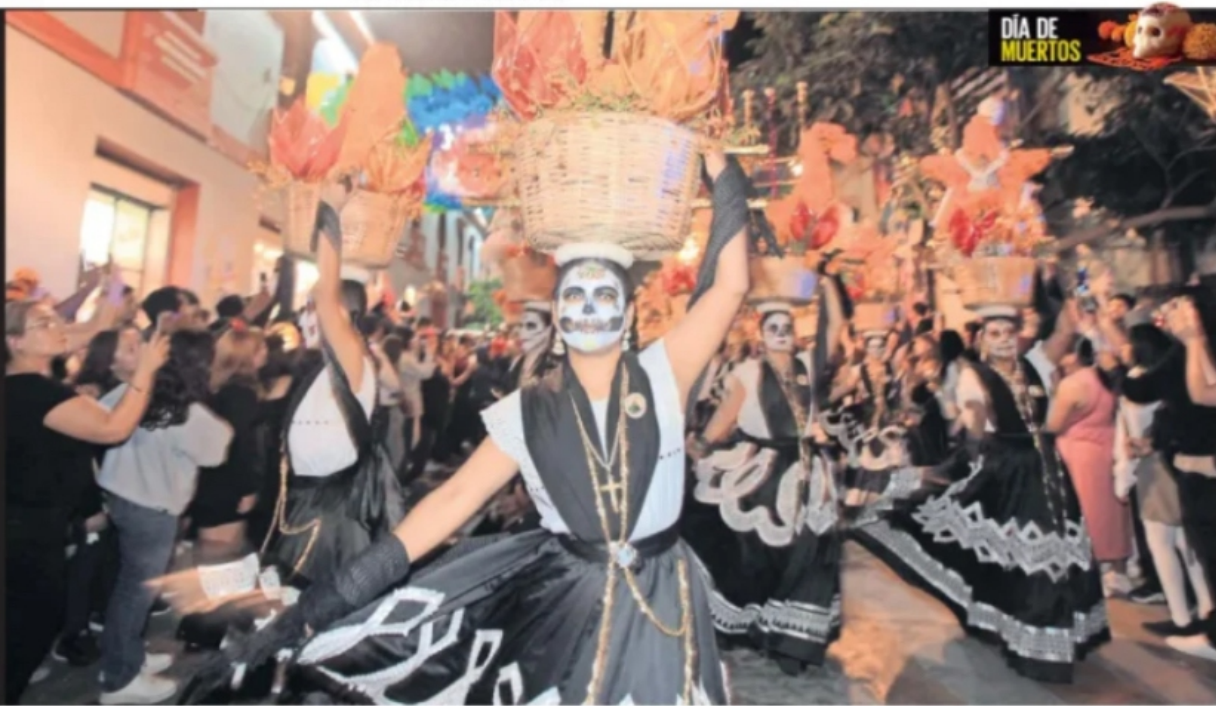
EDWIN HERNÁNDEZ, EL UNIVERSAL

Oaxaca.— Especialistas critican que las celebraciones tradicionales del Día de Muertos han sido transformadas para atraer a visitantes nacionales y extranjeros. Así, en las muerteodas hay mayor presencia de turistas, mientras que en los panteones las familias locales visitan a sus difuntos en medio de recorridos turísticos. Consideran que la gentrificación abona en el apropiamiento cultural. LAUI