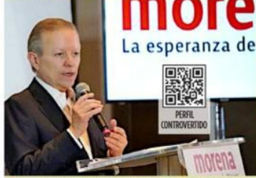
■ Arturo Zaldívar, ex Ministro y coordinador de Política y Gobierno de la Presidencia.