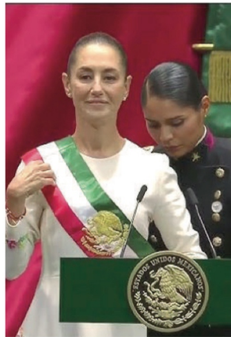
Claudia Sheinbaum Pardo