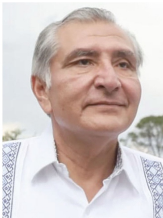
Adán Augusto López Hernández