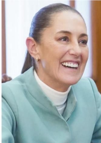
Claudia Sheinbaum Pardo