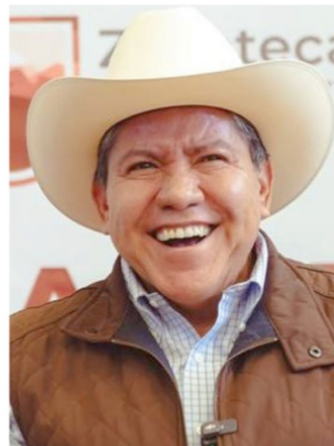
David Monreal Ávila