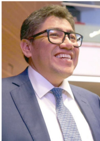
Saúl Monreal Ávila